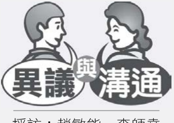
採訪：趙敏能、李師堯

我信了耶穌以後，因耶穌給我的永生祝福，心靈一直得到很大的安慰。在榮基，我有一位很好的福音老師，使我能夠進一步了解基督教信仰。我現今每天晚上都禱告，求神不斷的來引導我走完人生的路。我心中充滿感恩和喜樂，因此我開口對我的家人和朋友分享我內心的感受，並希望他們都能信耶穌。